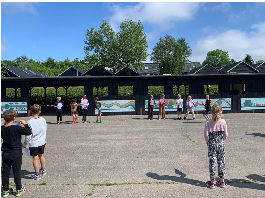
Ude matematik (tal leg) og drengehörn