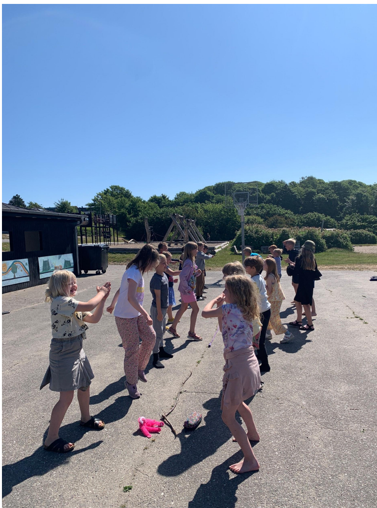
Spejlings stopdans (foroven) og skyggetegning (nedenfor)