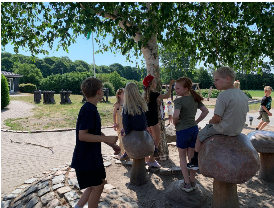
Udstillingen af vores Hundertwasser-tema i billedkunst klargøres op til til sommerfesten